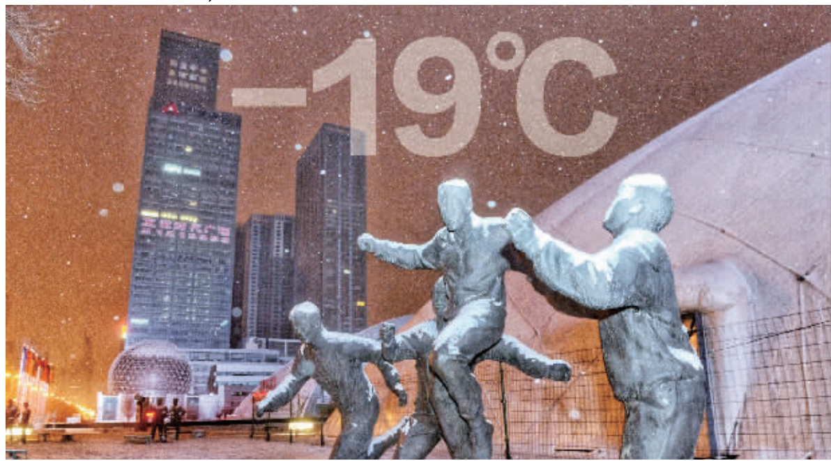
12月6日,沈阳迎来一场降雪,气温随之下降