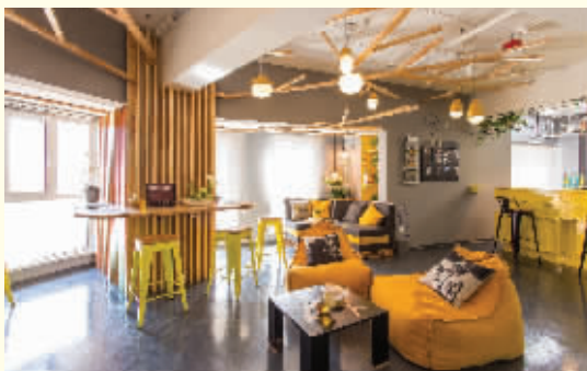
在浑南,寓见更好生活 泊寓明天广场店 已开业)