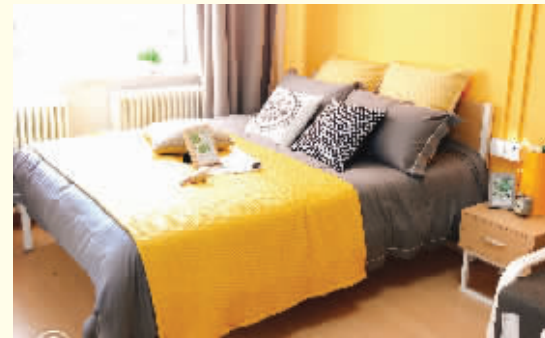
一环公园旁,租房好时光 泊寓万柳塘路店 已开业)

这里是城市的中心,也是城市青年的生活中心。为了打造更符合年轻群体消费的居住方式。主打小资、文艺的潮流调性。