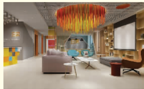
为租住梦想,包容中心万象 泊寓热闹路店 待开业)

以沈阳工业记忆为蓝本,融合工业4.0文化设计元素,集智能化、参数化、科技化,探索空间的无限可能,打造工业风强烈的个性品质小宅。