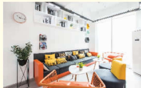
城市新青年,未来生活圈 泊寓金域华府店 已开业)

作为东北首家“社交型租住社区”,于2016年在浑南开启美好租住生活。租户群体年轻而富有活力,这里是一起看电影、玩桌游,在厨房制作美食的欢乐场景。各种青年潮流时尚聚会,结交朋友,开拓人生视野,让年轻人体会独处时的自由,群居时狂欢的乐趣。