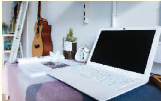
城市繁华主场,中心租住生活 泊寓总站路店 已开业)

泊寓金域华府店位于怒江街与文大公路交会处,临近沈北大学城。时尚简约的设计风格,让一个有颜值的专属社交住区脱颖而出。这里,配备了288间房间,时尚灵动平层户型以及温馨个性LOFT,打造活力的青春节奏,为城市青年带来真正想要的生活。